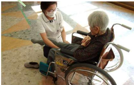
スムーズに体を動かせるように肩や肘、足の曲げ伸ばしを入念に…！！

時には複数名のリハビリスタッフで訓練を行うこともあります。意見を出し合いながらより良いリハビリの提供を心掛けています。