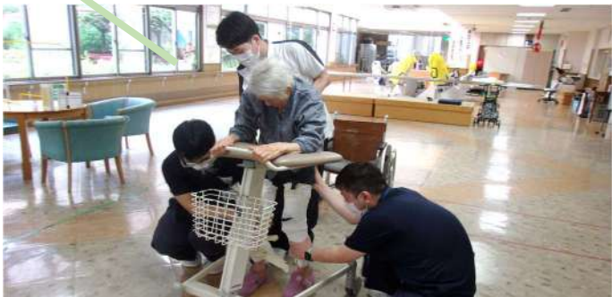
他にもストレッチを行うことで、体の痛みや状態を、ご本人とコミュニケーションをとりながらチェックすることもできます。