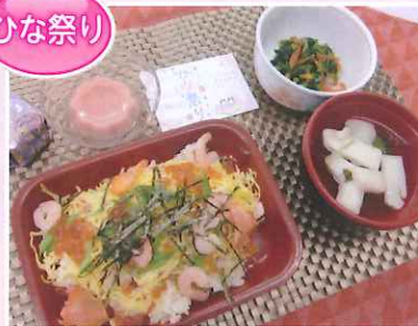
ちらし寿司・菜の花のからし和え・はんぺんのすまし汁・桜餅ゼリー