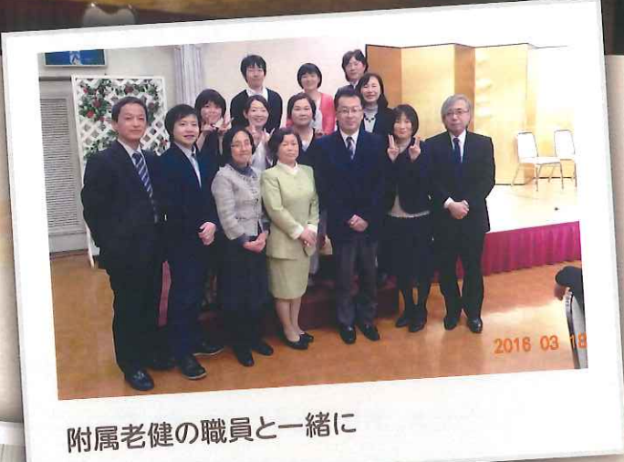
附属老健の職員と一緒に