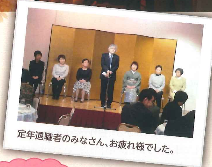
定年退職者のみなさん、お疲れ様でした。