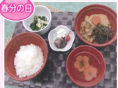
精進煮物(油揚げ・切昆布)・おひたし・生麩の吸い物・ぼたもち風