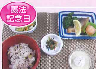
お赤飯・照り焼き魚・生姜和え 高菜漬・栗の豆乳プリン

今月は、「憲法記念日」「こどもの日」「母の日」の行事食を紹介します。栄養管理室一同、「安心・安全」な食事に心がけて、栄養管理と調理をしています。