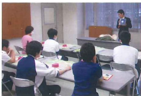
▲AEDの説明を受ける参加者