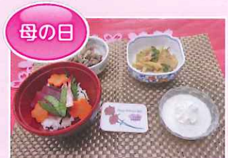
海鮮丼・竹の子の土佐煮・きのこの 梅肉和え・牛乳寒のクリームかけ