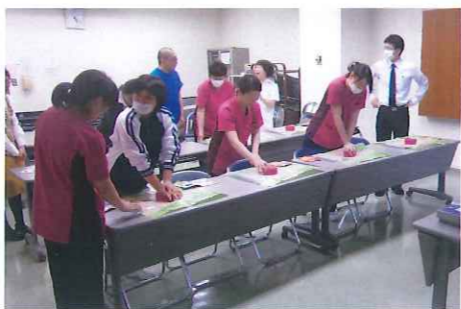
▲AEDの操作を行う参加者