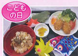
竹の子ご飯・カニ爪フライ 土佐酢和え・つぼ漬・柏餅