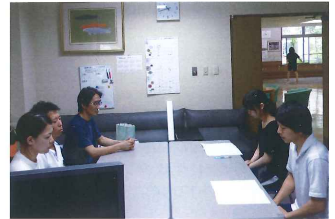
実習成果の発表をしている様子