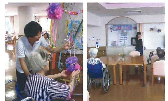
利用者さんと一緒に作品飾りや、体操をしました