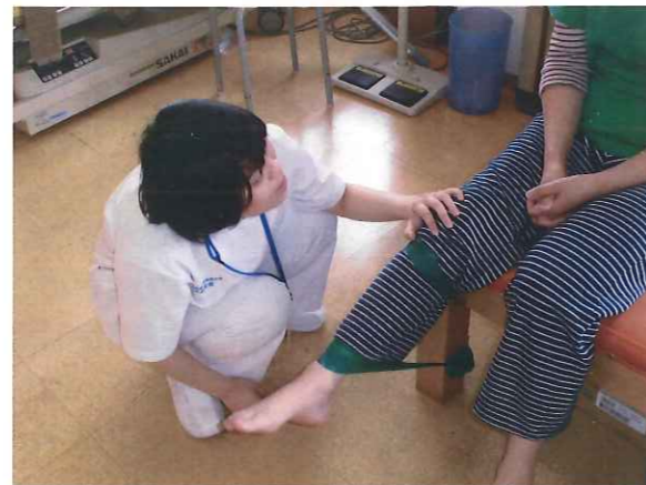
筋力トレーニング指導の様子