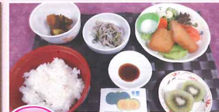
冬至 エビカツ・冬至かぼちゃ・きのこの梅肉和え・キューイフルーツ

今月は、年末年始に提供した食事を紹介します。栄養管理室では、「安心・安全」な食事に心がけて、栄養管理と調理を行っております。