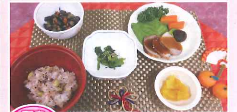
天皇誕生日 お赤飯・煮豚・五目炒め・お浸し・フルーツ