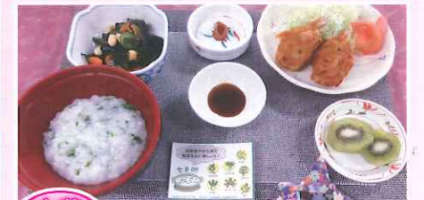
七草がゆ 七草かゆ・カニ爪フライ・わかめの和え物・梅干し・フルーツ