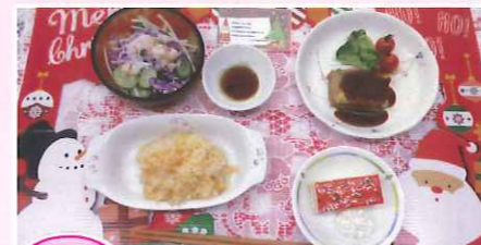
クリスマス 人参ピラフ・ミートローフ・カニサラダ・クリスマスケーキ