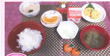
三日とろろ 玉子と豆腐のしんじょう・三日とろろ・ゆず大根・味噌汁・フルーツ