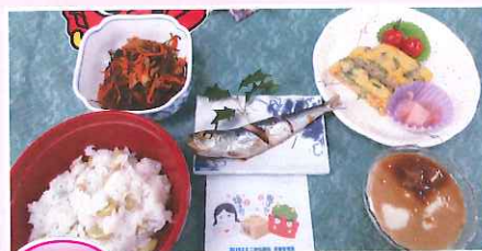
節分 豆ごはん・いわしの尾頭付き・煮物・卵焼き・デザート