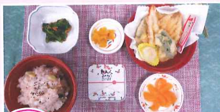
成人の日 赤飯・天ぷら・ピーナッツ和え・つぼ漬・みかん缶

今月は、成人の日と節分に提供した食事を紹介します。栄養管理室では、「安心・安全」な食事に心がけて、栄養管理と調理を行っております。